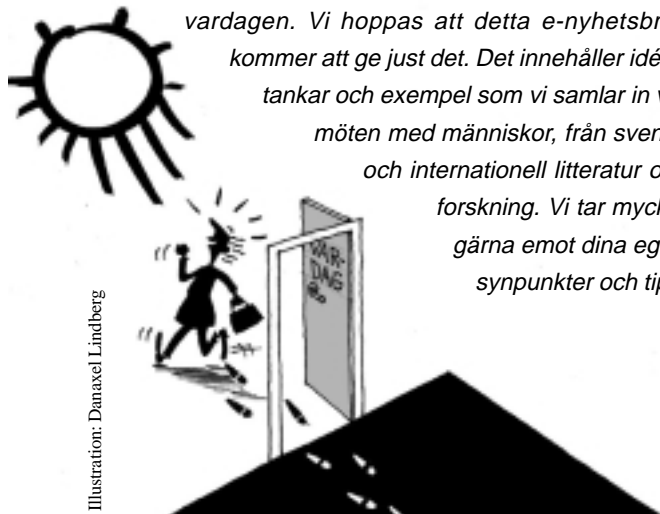
Illustration: Danaxel Lindberg

Eftertanke och dialog leder ofta till nya perspektiv och insikter som kan ta sig olika uttryck - ibland som förnöjsamhet, ibland som framväxande beslut om förändring. Men det är svårt att förändra. Mitt i vardagsfloden är det lätt att glömma goda föresatser. Det är ju en sak att bli väckt, en helt annan att faktiskt kliva ur sängen. Vi behöver påminnelse, bekräftelse, stöd och inspiration då vi försöker utveckla våra livsvillkor i vardagen. Vi hoppas att detta e-nyhetsbrev kommer att ge just det. Det innehåller idéer, tankar och exempel som vi samlar in via möten med människor, från svensk och internationell litteratur och forskning. Vi tar mycket gärna emot dina egna synpunkter och tips.